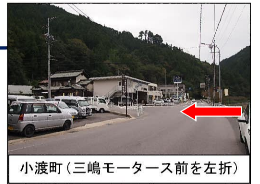
小渡町（三嶋モータース前を左折）