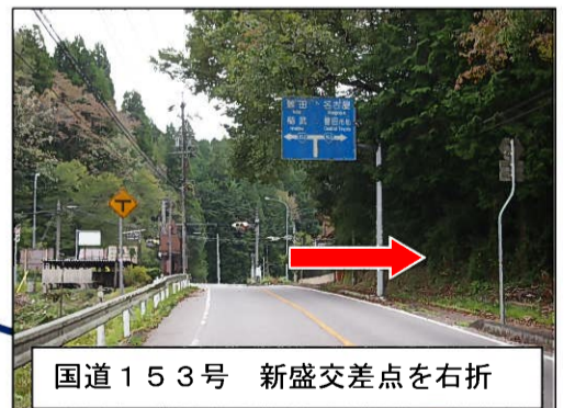
国道 153 号 新盛交差点を右折