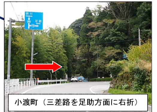
小渡町（三差路を足助方面に右折）