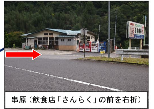
串原（飲食店「さんらく」の前を右折）