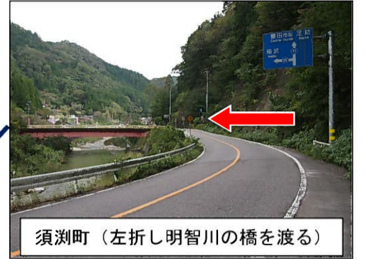
須淵町（左折し明智川の橋を渡る）